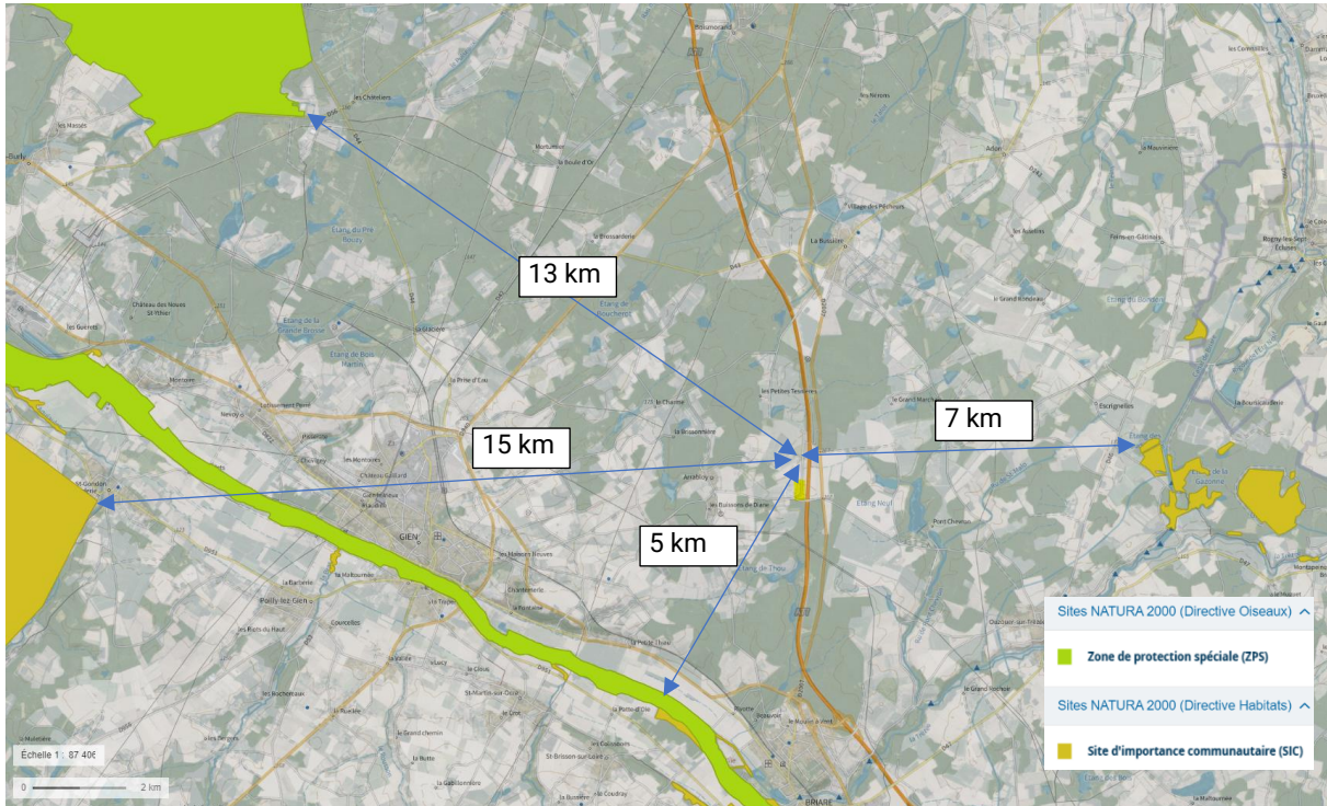
Figure 2 : Localisation des zones « Natura 2000 »

Les sites « Natura 2000 » sont désignés pour protéger un certain nombre d'habitats et d'espèces représentatifs de la biodiversité européenne. La liste précise de ces habitats et espèces est annexée à la directive européenne oiseaux et à la directive européenne habitats-faune-flore.